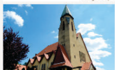
Ivánca Szent Miklós katolikus templom