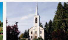
Órimagyarósd Evangélikus templom