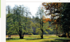
Szőce Tőzegmohás léprét