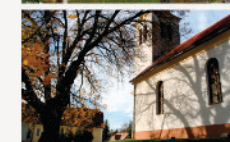
Kondorfa Katolikus templom