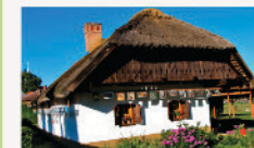
Nagyrákos Tájvár és kovácsműhely