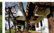
Szalafő Népi Műemlékegyüttes Pysersztr