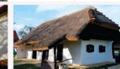
Magyarszombatfa Fazekas ház