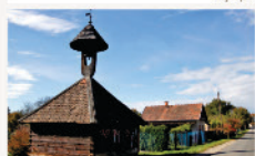
Kercaszomor Református fa hársangláb