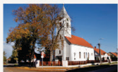
Bajánsenye Református templom