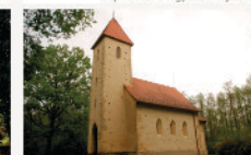
Velemér Szentháromság templom