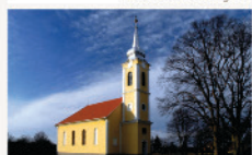
Kisrákos Református templom