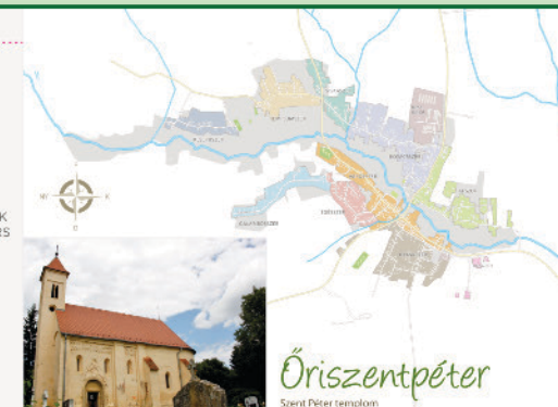
Óriszentpéter Szent Péter templom